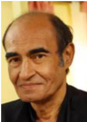
Lire la bio