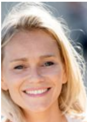
Lire la bio