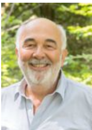
Lire la bio