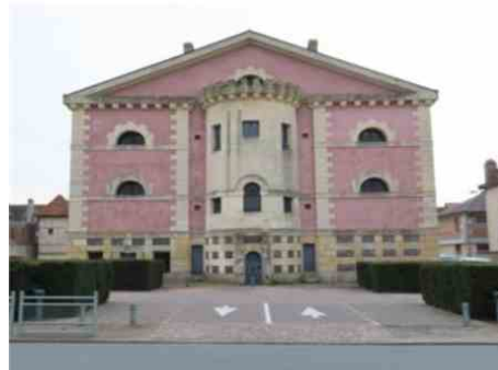
La Joyeuse prison de Pont-l'Évêque sera de nouveau sous les feux des projecteurs, mercredi, pour l'émission « Enquêtes de région ».

« L'annonce de ce tournage nous permet également d'annoncer la diffusion du téléfilm Meurtres à Pont-l'Évêque tourné dans la Joyeuse Prison fin 2019 samedi prochain, le 20 février, sur France 3 , à 21 h 05. »