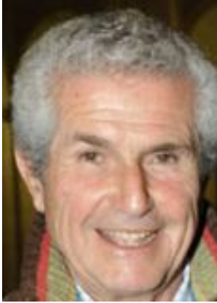
Lire la bio