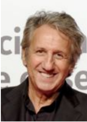
Lire la bio