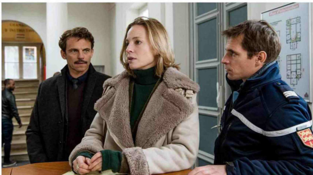
F. VIALA/AVIA PRODUCTIONS 2020 / JEAN-PIERRE DIAL TEL