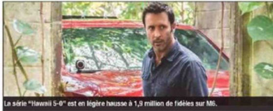
La série "Hawaii 5-0" est en légère hausse à 1,9 million de fidèles sur M6.

Samedi soir, TF1 a rassemblé 5,6 millions de téléspectateurs attirés par la 3e session des auditions à l'aveugle du talent show "The Voice" présenté par Nikos Aliagas. La Une obtient 26,5% de part d'audience et le programme perd 300 000 téléspectateurs sur une semaine. France 3 suit avec le téléfilm "Meurtres à Pont-l'Évêque" qui a tenu en haleine 5,1 millions d'amateurs soit 21,6% de part d'audience selon les chiffres de Médiamétrie. Le précédent inédit intitulé "Meurtres à Albi" en avait attiré 6,2 millions. Sur France 2, le divertissement en rediffusion "Les comiques pré-