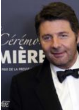
Lire la bio