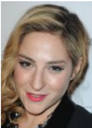
Lire la bio