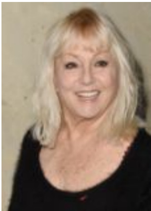
Lire la bio