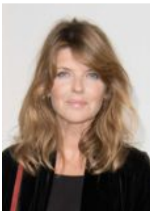
Lire la bio