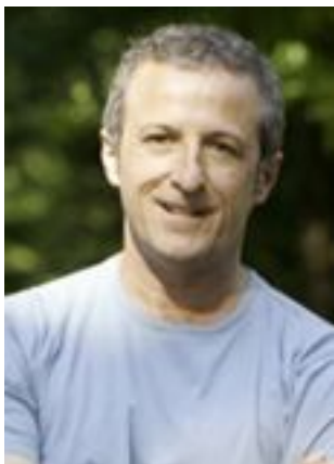
Lire la bio