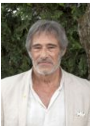
Lire la bio