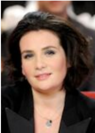
Lire la bio