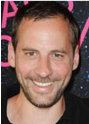
Lire la bio