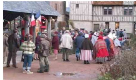
Pendant le tournage dans les jardins de l'espace culturel les Dominicaines..