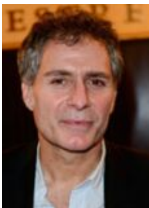
Lire la bio